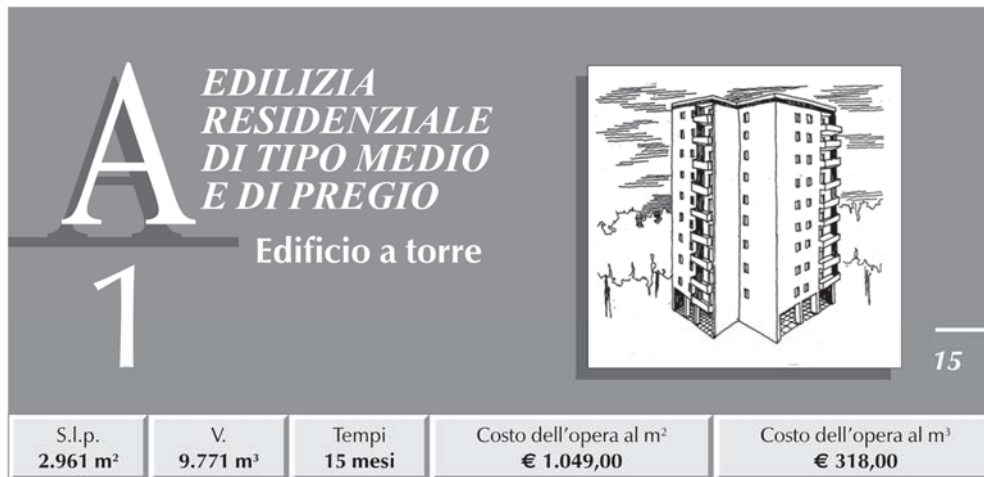
TABELLA RIASSUNTIVA DEI COSTI E PERCENTUALI D'INCIDENZA